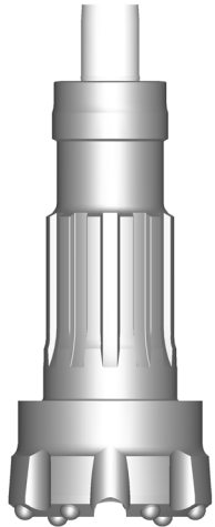
Manche de Trépa QL60